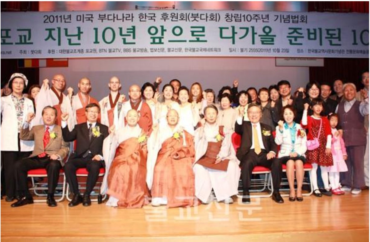
미국 불국사 한국후원회 붓다회는 지난 23일 한국불교역사문화기념관 전통문화예술공연장에서 창립 10주년 특별기념법회를 봉행했다.