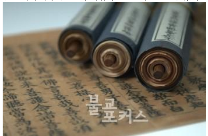
▲ 초조대장경 인경본

「재조대장경」과의 A와 A°라는 관계가 아니라 제작 시기와 방식에서 구별되는 천년의 문화유산이다. 고려가 몽고와의 전란 속에서 현존 최고의 목판대장경인 고려 「재조대장경」을 다시 조성할 수 있는 배경에는 이미 「초조대장경」을 제작해 본 경험이 있는 고려인들의 축적된 기술적 역량이 있었기에 가능했다. 고려대장경의 글씨를 본 조선시대 명필 추사 김정희 선생은 “이는 사람이 쓴 것이 아니라 마치 신선이 내려와서 쓴 것 같다”고 감탄해 마지않았다. 또한 오자나 탈자가 거의 없는 고려대장경이 만들어지기까지는 고려의 승려 의천(義天)국사, 수기(守其)대사와 같은 분들의 끊임없는 노력이 있었기 때문이다. 고려 재조대장경의 총 글자 수는 5200만 자로